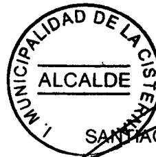
SANTIAGO REBOLLEDO PIZARRO ALCALDE